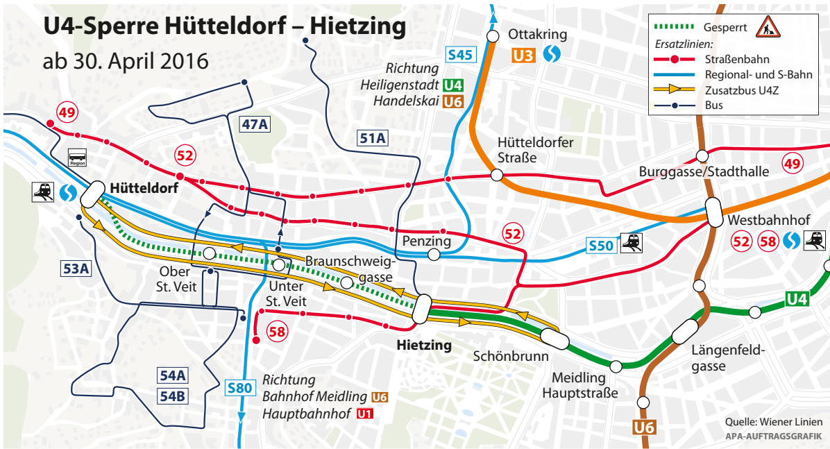
1. Phase der U4-Sperre von Hütteldorf bis Hietzing ab 30. April